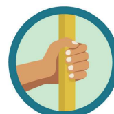
CONTATO COM SUPERFÍCIES