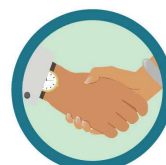
CONTATO FÍSICO COM PESSOA